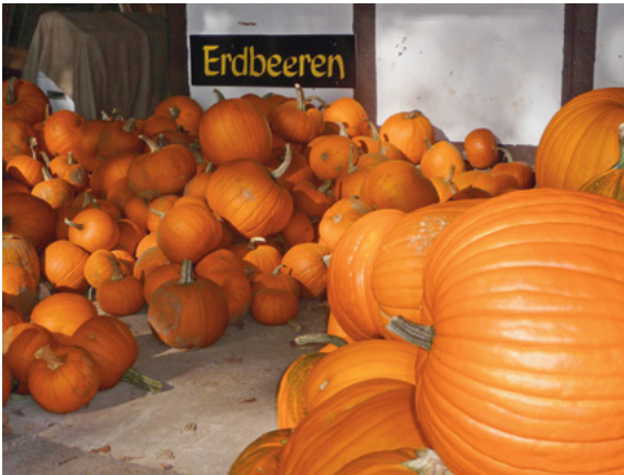
Das passiert, wenn man seine Erdbeefelder überdüngt. Haltern (Nordrhein-Westfalen)