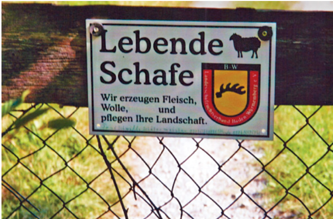
Lebende Schafe leisten mehr als tote. Sie kommen sogar ohne menschliche Hilfe aus und bieten ihre Erzeugnisse und Dienste in Eigenregie an.

Sachsenheim, Ortsteil Spielberg (Baden-Württemberg)