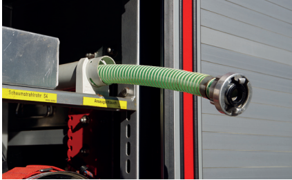
Abbildung 13: „Artgerechte“ Lagerung eines Schaummittel-Ansaugschlauchs