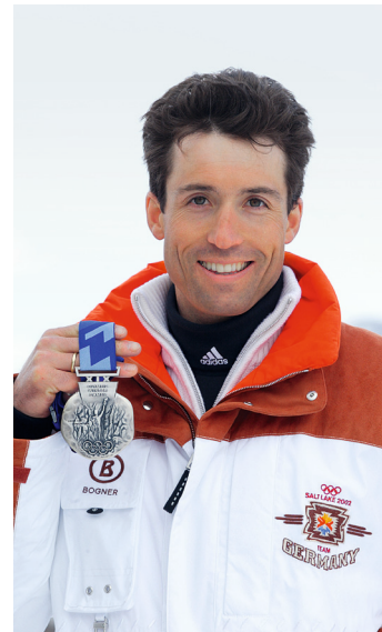
Höchster Lohn: Peter Schlickerieder und seine olympische Silbermedaille 2002 in Salt Lake City.