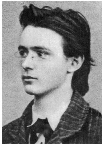
Rudolf Steiner als Maturant (Abiturient) der Oberrealschule Wiener-Neustadt, 1879

Ausschlaggebend für den Lebensweg des jungen Steiner waren seine Lust am Lernen und seine weitgespannten Interessen. Durch seine schulischen Lernerfolge konnte er aus dem dörflichen Milieu herauswachsen und Zugang zum intellektuellen Leben seiner Zeit finden. Sein Vater erkannte früh die Begabung des Sohnes und sorgte dafür, dass er neben dem Unterricht in der Volksschule «Extrastunden» erhielt. Damit sein Sohn die Höhere Schule besuchen und später einmal Eisenbahningenieur werden konnte, ließ sich der Vater an eine Bahnstation in die Nähe von Wiener Neustadt versetzen. Wegen seiner guten Schulnoten wurde Steiner in der lateinlosen, naturwissenschaftlich ausgerichteten Oberrealschule als «Vorzugsschüler» geführt; dadurch mussten seine Eltern kein Schulgeld mehr entrichten. Schon als Fünfzehnjähriger begann er überdies damit, Nachhilfeunterricht zu erteilen und so zu seinem eigenen Unterhalt beizutragen. Seine Maturitätsprüfung, die dem deutschen Abitur entspricht, bestand er «mit Auszeichnung». Damit erfüllte er die Voraussetzung für ein Studienstipendium an einer Technischen Hoch-