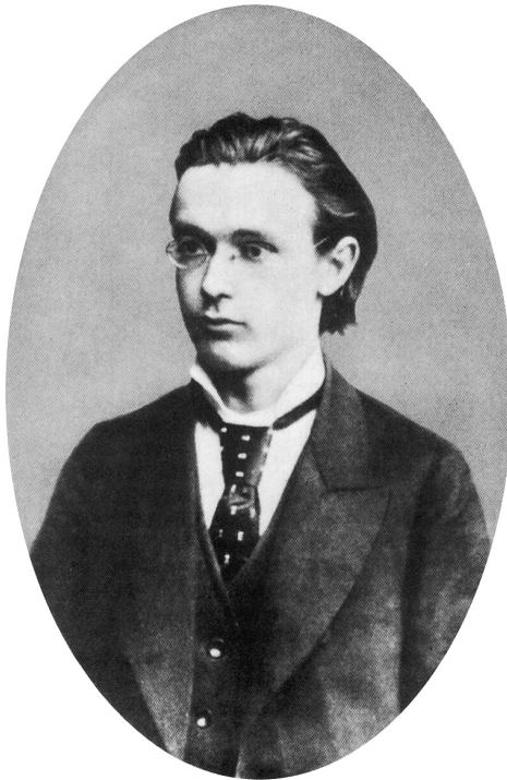
Student der Mathematik, Naturgeschichte und Chemie: Rudolf Steiner um 1882

versität Wien blieben dem begabten jungen Studenten verschlossen, weil er nicht die erforderliche gymnasiale Matura in Latein (und Griechisch) erworben hatte.