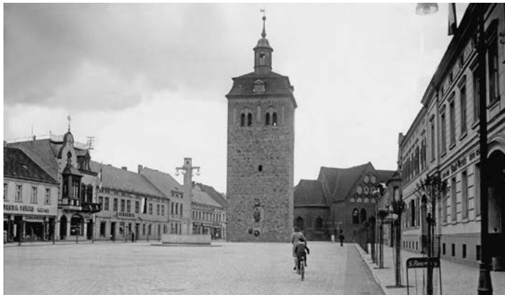
Marktplatz von Luckenwalde um 1930

* Luckenwalde war keine Großstadt, doch mit seinen zahlreichen Tuchfabriken hatte es sich zu einem Industriezentrum in der Region entwickelt. Die Bevölkerung bestand zum größten Teil aus Arbeiterfamilien. Entsprechend hoch war vor der Hitler-Zeit der Anteil an Sozialisten im Ort. Bevor die Nazi-Diktatur jede Opposition verbot, wählten die Luckenwalder zu 80 Prozent SPD.