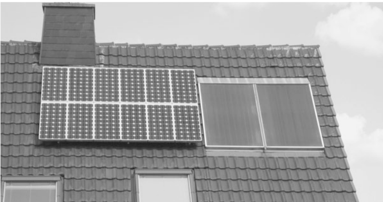
Abb. 1.1 Photovoltaik- ( links ) und Solarthermieanlagen ( rechts ) nutzen beide die Solarenergie

Das Strahlungsangebot der Sonne kann auf vielerlei Weise genutzt werden. Photovoltaikmodule wandeln die Solarstrahlung in elektrische Energie um, Solarkollektoren dagegen wandeln die Energie der Sonne in Wärme um. Diese Nutzungsart wird als „Solarthermie“ bezeichnet. Abbildung 1.1 zeigt beide Varianten nebeneinander.