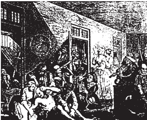
Abb. 5: Irrenanstalt „Bedlam“ in London (18. Jahrhundert) (aus Payk 2000, 158)

In verschiedenen Institutionen und Anstalten, die übernommen oder neu gegründet wurden, standen also weiterhin restriktive Maßnahmen in den Irrenanstalten im Vordergrund (Abb. 5). Es wird auch von Zucht- und Arbeitshäusern gespro-