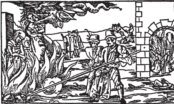
Abb. 4: Hexenverbrennung im Mittelalter (aus Payk 2000, 235)

Im Mittelalter gewann die Vorstellung, psychisch veränderte Menschen seien vom Teufel besessen oder verhext, immer mehr an Gewicht; nur selten wurden sie als von Gott eigens Begnadete angesehen. Der mit der Inquisition ausufernde Hexen- und Teufelsglaube führte dann dazu, dass viel Unrecht geschah, indem zahlreiche psychisch Kranke als „bessessen“ verfolgt und gefoltert, beim Exorzismus oder nach spektakulären Prozessen als Hexen getötet wurden (Abb. 4). Durch eine Aussonde-