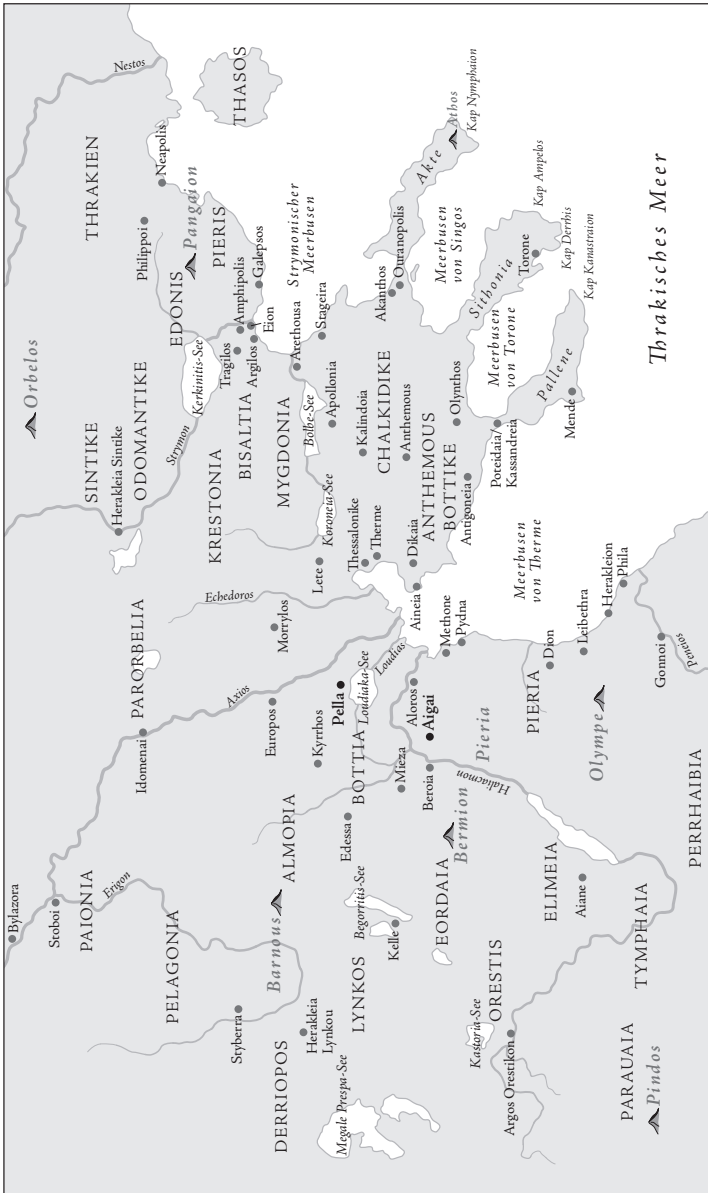
Karte 1: Makedonien und der makedonische Herrschaftsbereich im 4. Jh. v. Chr.