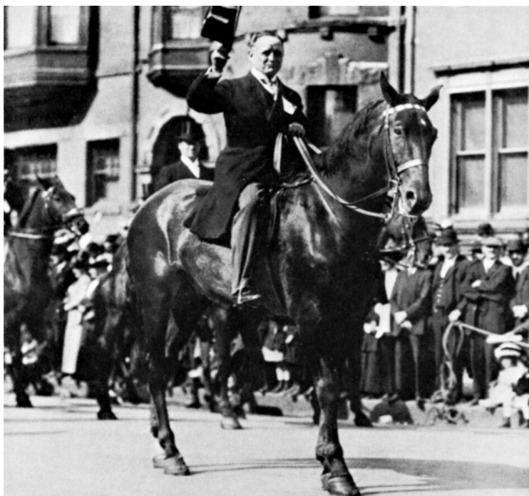
Der Großvater mütterlicherseits: John F. Fitzgerald, Bürgermeister von Boston

dern zu Hause bei den sechs Kindern bleibt. Rose, das älteste Kind, will alles anders machen.