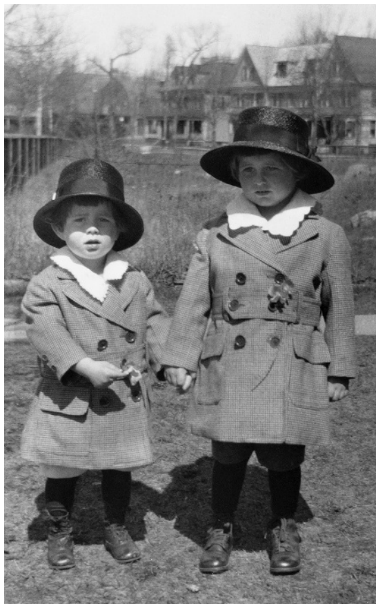
John F. Kennedy (links) und sein Bruder Joseph, 1921. John zeigt mit dem rechten Finger auf die linke Hand, die offensichtlich vom älteren Bruder gequetscht wird.

Antriebsverlust. So ist es auch bei Rosemary. Sie wird in die Obhut der Nonnen von St. Coletta in Wisconsin gegeben. Der Öffentlichkeit aber wird weisgemacht, Rosemary habe sich zurückgezogen, um sich der Pflege geistig behinderter Kinder zu widmen. So wird noch aus ihrer Tragödie politisches Kapital für die Familie geschlagen.