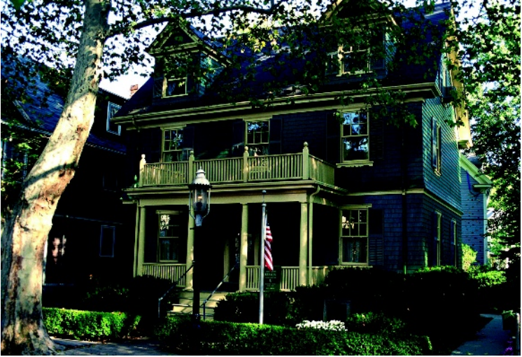
Das Geburtshaus John F. Kennedys in Brookline, Massachusetts, 2003