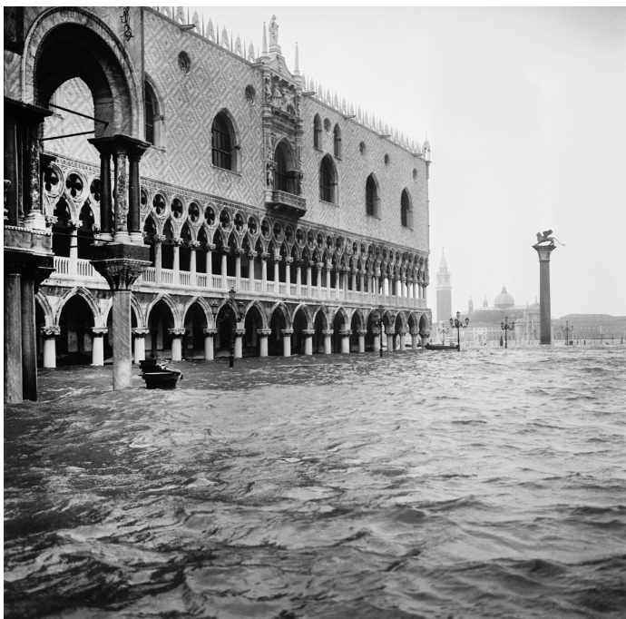
I Der überschwemmte Markus-Platz während des Hochwassers 1966

am intensivsten empfunden wird – als Irritation und Beruhigung gleichermaßen.