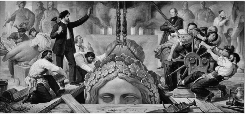
2 – Wilhelm von Kaulbach, Die Erzgießerei. Guss der Bavaria unter der Leitung Ferdinand von Millers , 1854 (München, Neue Pinakothek)

Einheimische und Besucher, erfahrbar für noch weit mehr Kunstbegeisterte in ganz Europa durch Zeitungen, Publikationen und Bildmedien. Über die Hauptstadt hinaus richtete sich Ludwigs Blick auf das gesamte Königreich Bayern. Mit den Nationaldenkmälern in Kelheim und Donaustauf, den Domrestaurierungen und Überformungen in Regensburg, Bamberg und Speyer, mit den Villen in Aschaffenburg und in Edenkoben in der Pfalz, schließlich mit den vielen Personendenkmälern überall im Land: Der König wollte nicht nur in seiner Hauptstadt, der gleichwohl sein Hauptaugenmerk galt, Kunst «in's Leben treten» lassen, sondern überall in Bayern. Die aus Ludwigs Sicht wichtigen gesellschaftlichen, künstlerischen und politischen Botschaften kamen dabei nicht nur durch die Bauwerke selbst zum Ausdruck, sondern vor allem durch ihre Ausstattung mit Malerei und Skulpturen.