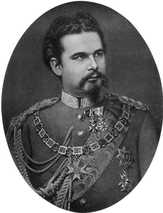
Abb. 1: König Ludwig II. in großer Generalsuniform mit Band und Kette des Hubertusordens, um 1880.