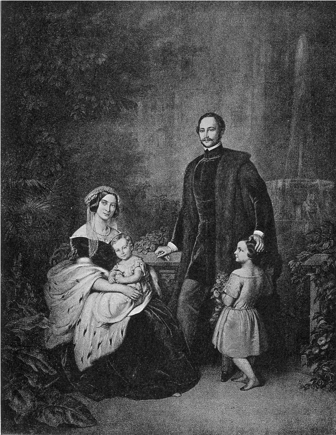
Abb. 2: König Maximilian II. von Bayern mit Königin Marie und den Söhnen Ludwig und Otto im Schlossgarten zu Hohenschwangau, 1850.