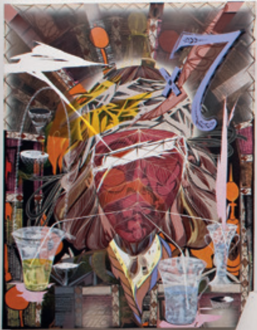
Lari Pittman Untitled (2008) Acrylic, cel vinyl, spray lacquer over gessoed canvas over wood panel 132 × 101.6 cm