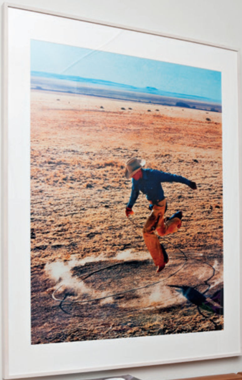
Richard Prince Untitled (Cowboy) (2003) Ektacolor photograph 168.3 × 127 cm Edition 2/2 + 1 AP