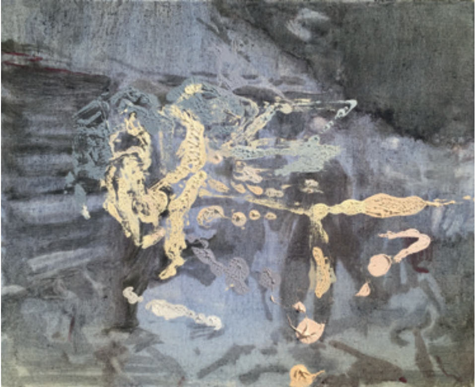
Hanneline Røgeberg In The Field (for Glenn) 2016 Oil on linen, 61 x 91 cm