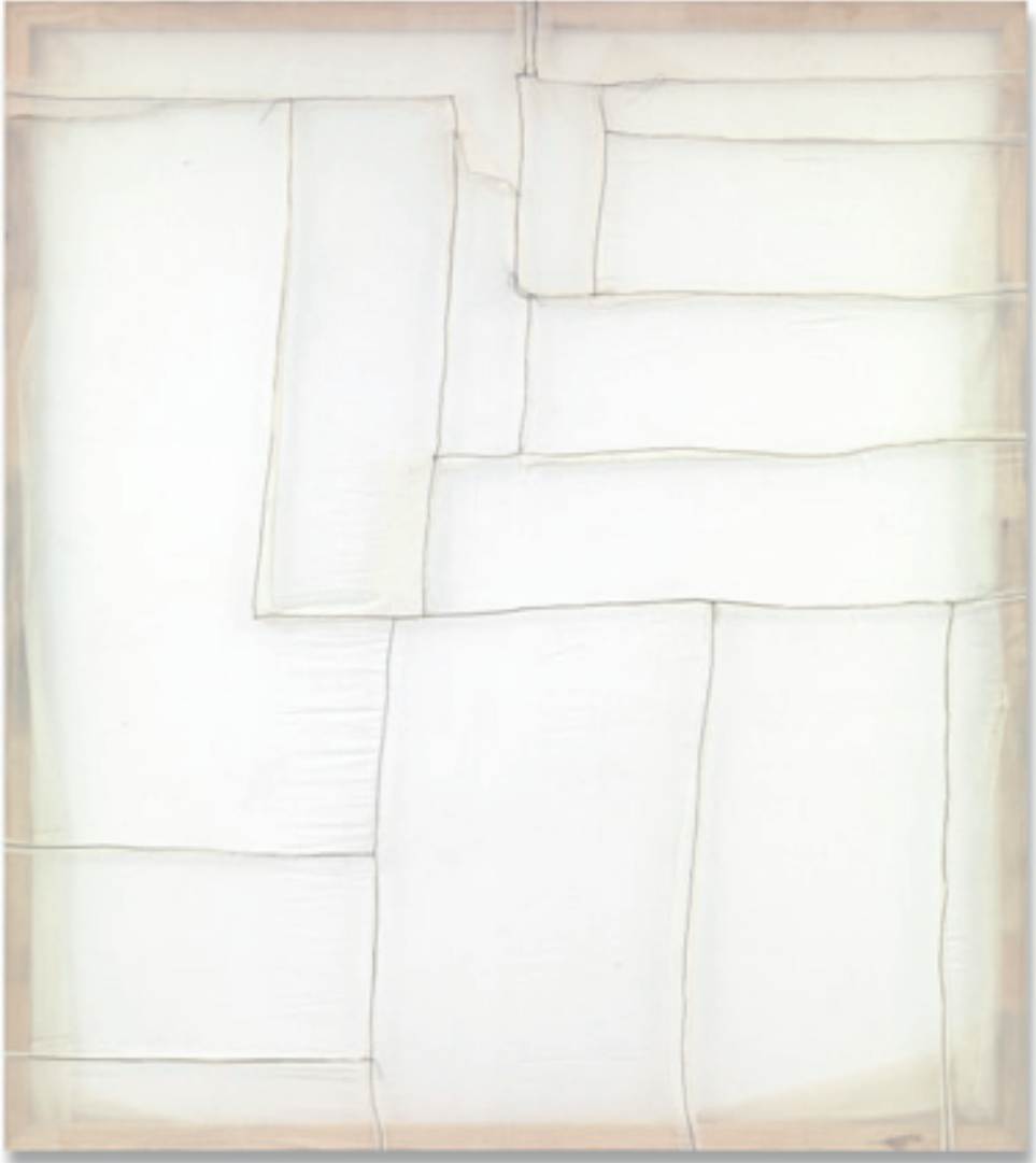
Sergej Jensen Untitled (2009) Sewn cloth 180 × 160 cm