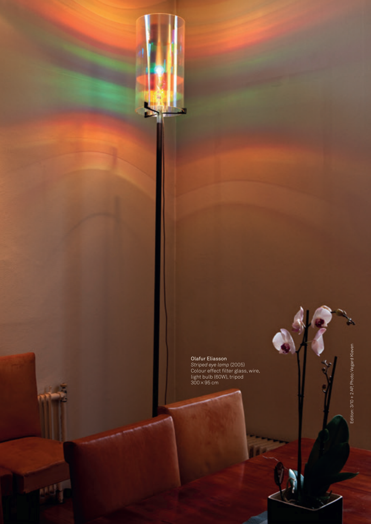
Olafur Eliasson Striped eye lamp (2005) Colour effect filter glass, wire, light bulb (60W), tripod 300 x 95 cm