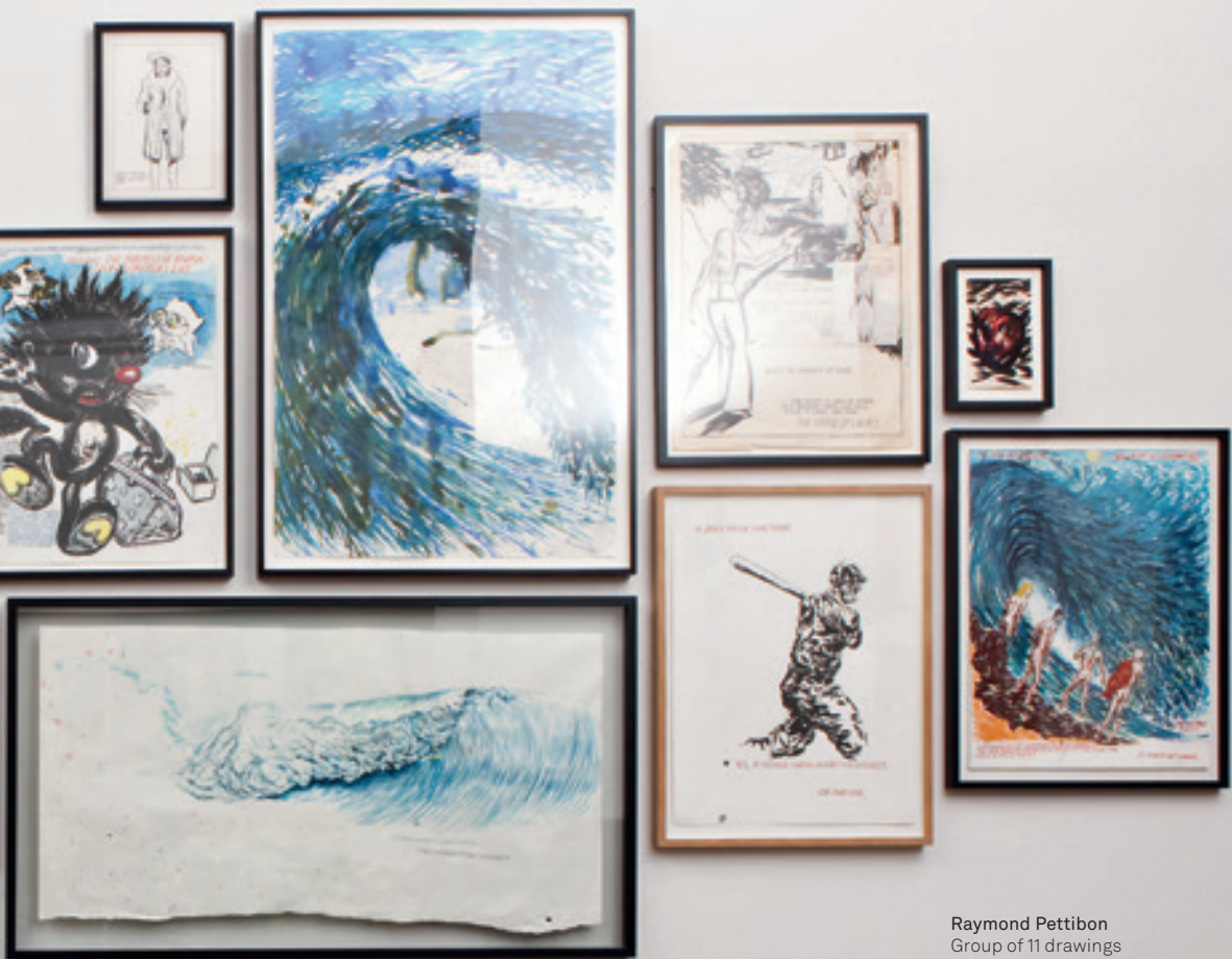
Raymond Pettibon Group of 11 drawings