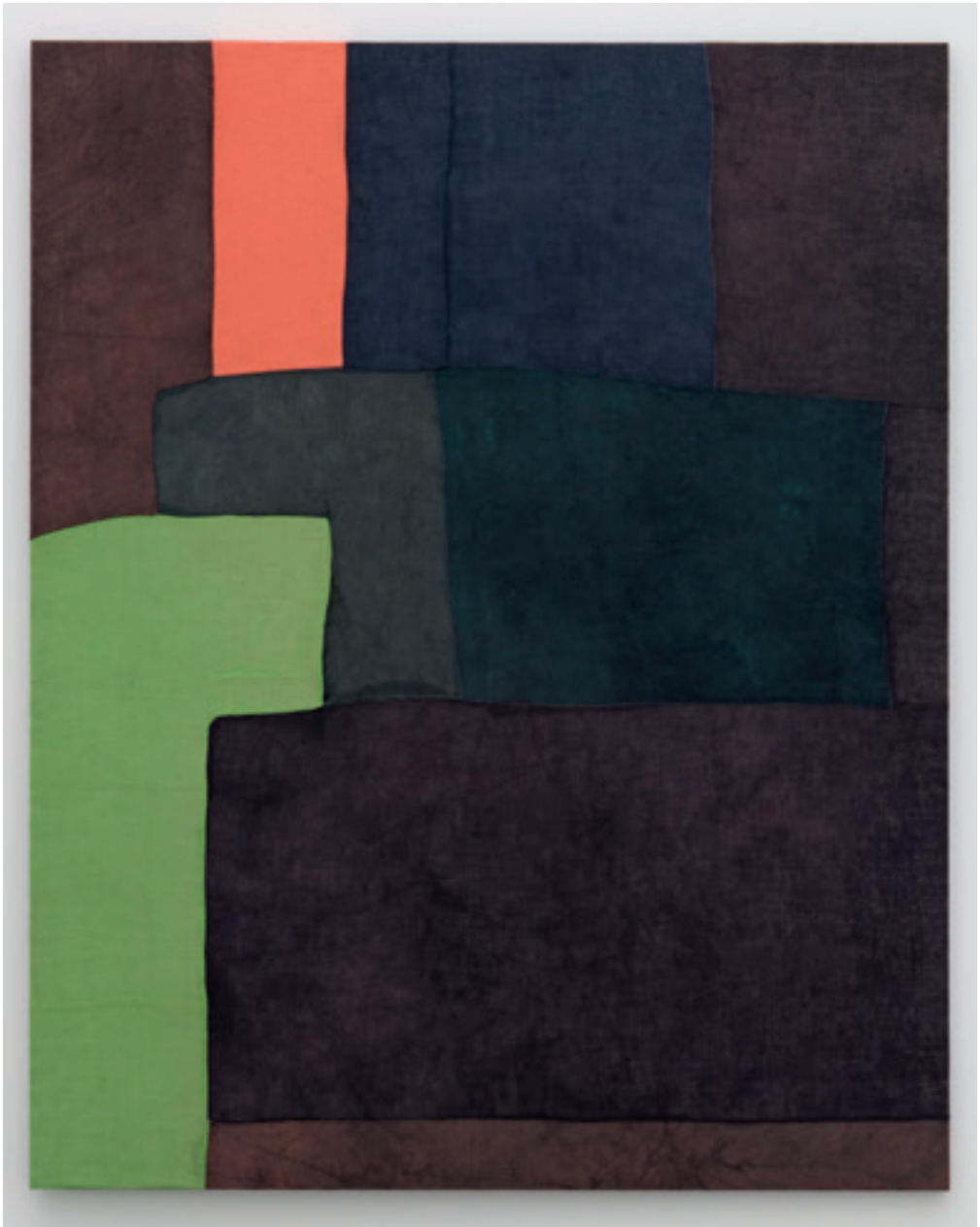
Sergej Jensen Untitled (2007) Dyed and sewn cloth 310 × 280 cm