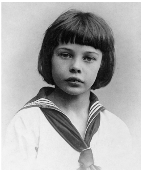
Abbildung 13: Peter Yorck, um 1910.