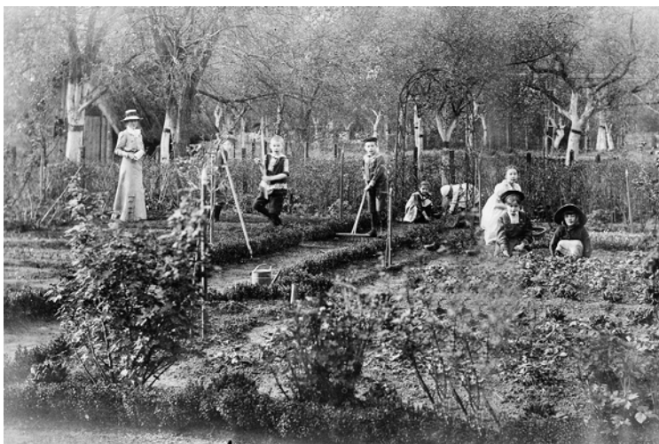
Abbildung 15: Die Yorck'schen Kinder bei der Gartenarbeit – jedes Kind hatte ein eigenes Beet zu bearbeiten.

sie in der Hierarchie eines großen land- und forstwirtschaftlichen Betriebes einnahmen.