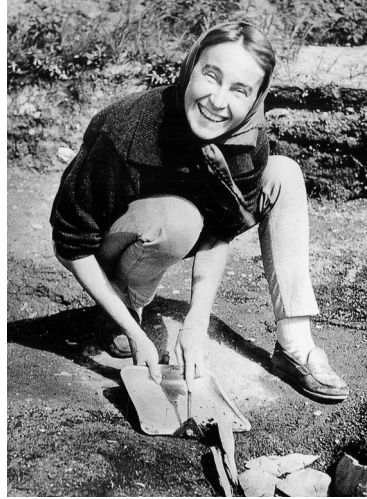
Anne Stine und Helge Ingstad

Baumaterials aus Grassoden bald, dass es sich hierbei tatsächlich um die Überreste einer skandinavischen Siedlung handeln könnte. In den Jahren von 1961 bis 1969 folgten dann unter der Leitung von Anne Ingstad acht Grabungskampagnen in L'Anse aux Meadows. 3 Am Ende dieser archäologischen Ausgrabungen stand fest: die acht oder neun Gebäude, die man gefunden hatte, stammten tatsächlich von Skandinavien der Wikingerzeit. Dazu gehörten neben drei größeren Wohngebäuden auch eine Reihe von Nebengebäuden, darunter eine etwas abgelegene, jenseits des Bachlaufs gelegene Schmiede. Dazu kommen vier zur See hin offene Vertiefungen an der Küste nördlich der Siedlung, die als Reste von in die Uferböschung eingetieften Bootsschuppen interpretiert werden.