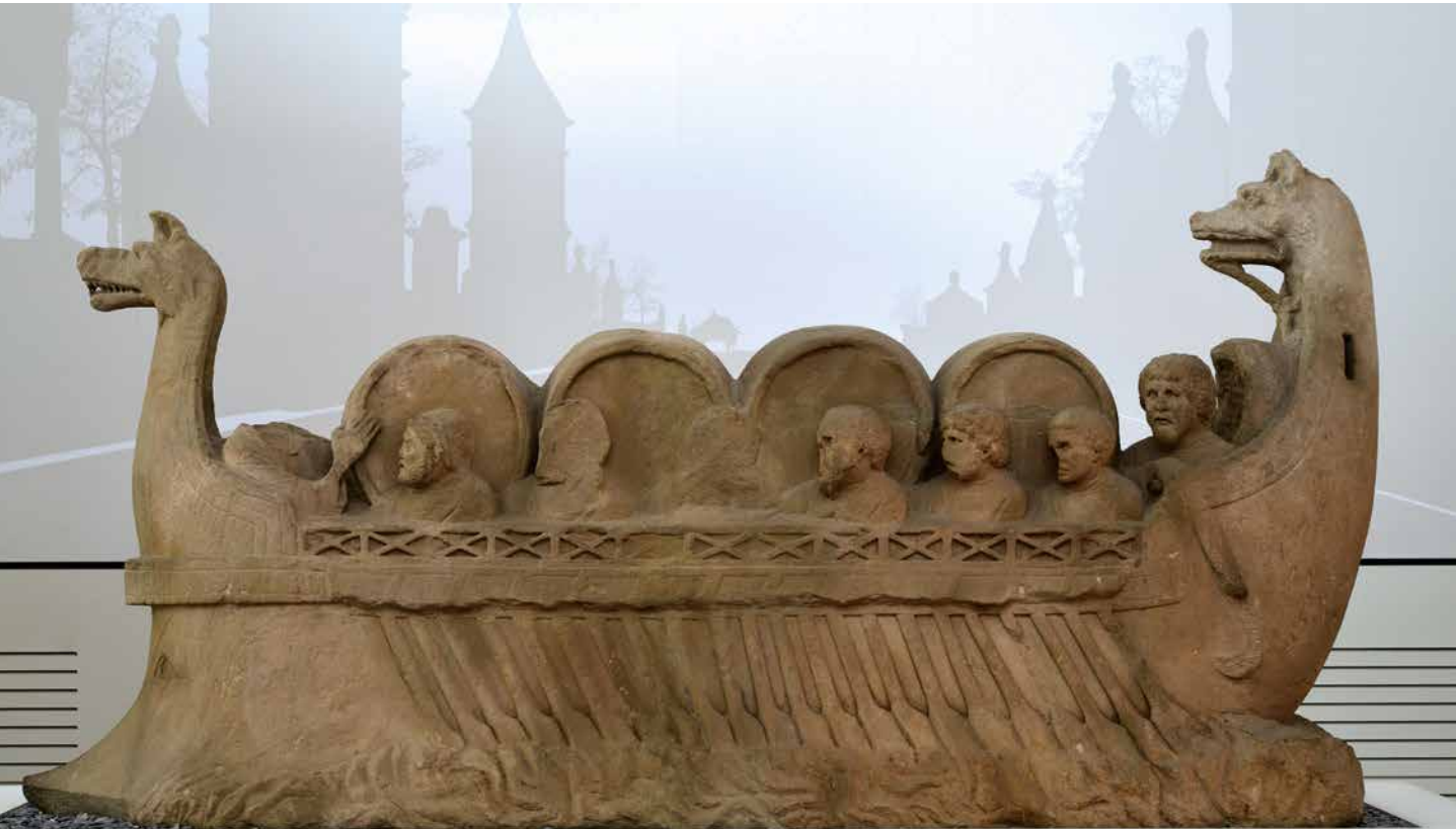
Steinernes Zeugnis uralter Weinkultur: Das römische Weinschiff von Neumagen.

Solche, einst mühevollen Arbeit von Galeerensklaven übernehmen manche Weinfreunde heute ganz freiwillig und mit Begeisterung. Und sie be-