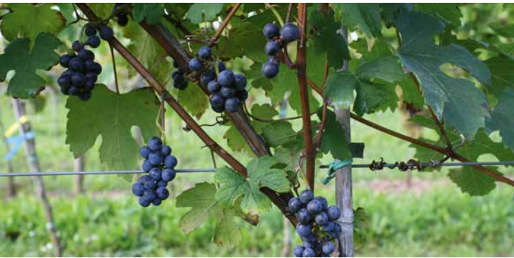
Sorgsam gehütet: Urrebe aus dem Sortiment des Bundesforschungsinstituts für Kulturpflanzen.

Es gibt sie noch, mitten in Deutschland: die letzten Urreben! Es sind streng geschützte und von den Natur- und Forstbehörden sorgsam gehütete Restbestände der Wildrebe „ Vitis Vinifera “, die wohl überall entlang des Rheins und der ebenfalls wärmebegünstigten Zuflüsse in den vor der Römerzeit einst üppigen, wilden Auwäldern existierte. Auf der Rheininsel Ketsch bei Heidelberg (Rhein-Neckar-Kreis) existieren noch vierzig solcher Ur-Rebstöcke. Auf den ersten Blick sehen sie im dschungelartigen Gewirr unterschiedlichster Bäume und Sträucher gar nicht wie Weinreben aus, sondern eher wie Lianen aus Tarzans Welt. In der Tat ranken sie zwischen zehn und dreißig Meter an Bäumen hoch. Ein unersetzlicher Naturschatz und gleichzeitig wissenschaftlich bedeutsames Gen-Potential.