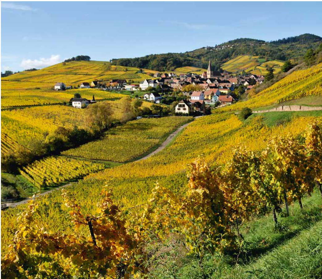
Harmonie von Natur und Kultur: Weinberge bei Niedermorschwihr im Elsass.

zeugt werden. Der Anteil am Weltweinkonsum in Europa beträgt 70 Prozent. Da die Rebanbaufläche in Deutschland nur rund 1,3 Prozent an den weltweiten Rebgebieten ausmacht – was einem Anteil an der Weltweinproduktion von 3,6 Prozent entspricht – bei gleichzeitigen 9 Prozent Anteil am weltweiten Weinkonsum, stehen die heimischen Erzeuger in starker Konkurrenz zu den Weinimporten. Nichts gegen Weltoffenheit und globale Vielfalt: aber wenn die reizvollen Weinbaulandschaften als lebendiges Natur- und Kulturerbe erhalten bleiben sollen, müssen die Verbraucher statt nur auf den Preis zu schauen und billige Importweine zu kaufen, den heimischen Erzeugnissen eine Chance geben. Deren Qualität hat sich seit den 1990er Jahren in allen Bereichen ganz erheblich verbessert.