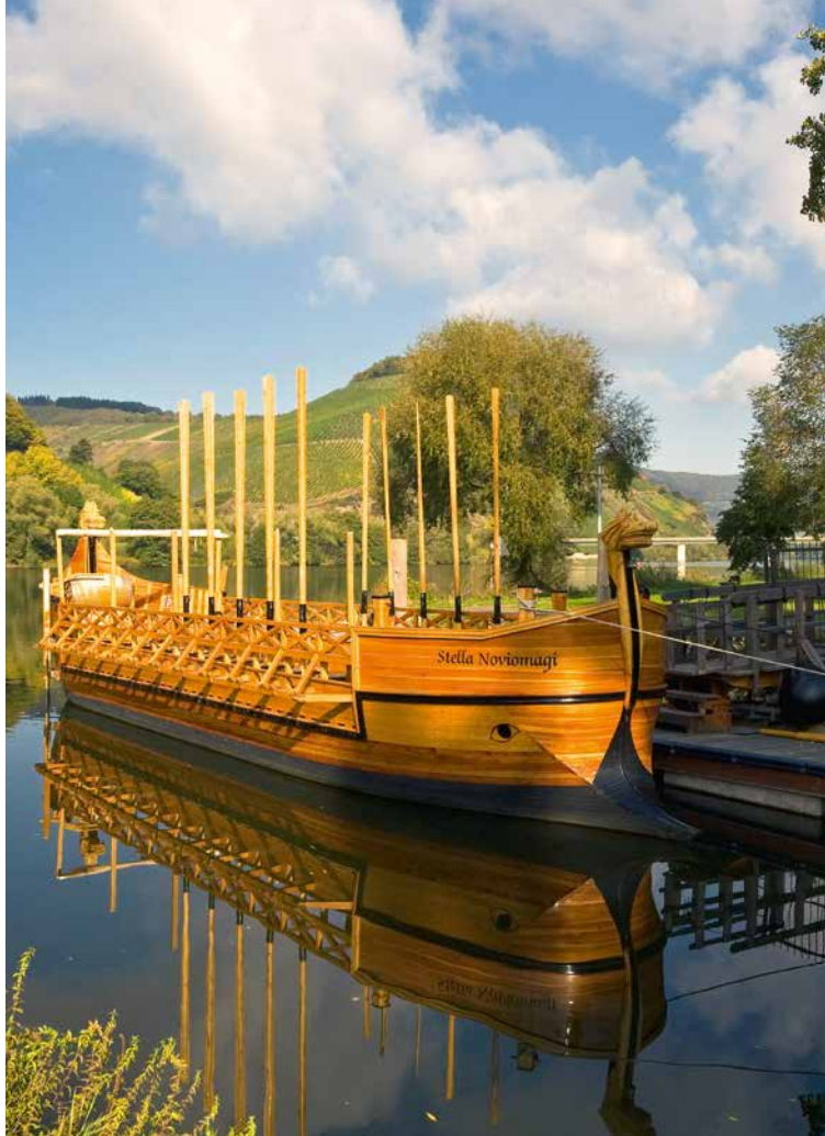
Lebendige Geschichte und Weinlanderlebnis auf der Mosel: Der Nachbau des Neumagener Römer-Weinschiffs.

Und so finden sich heute in vielen Museen sowie „Open Air“-Denkmälern interessante Beweise römischer Weinkultur. Dazu gehören Reste von Holzfässern, die den heutigen Barriquefässern recht ähnlich waren, Rebmesser, Traubenkerne, mit Reben und Weintrauben verzierte Jupiter-Gigantensäulen-, Grabstein- und Weihesteinschriften oder die Fundamente ehemaliger Weingüter. Eine große Anlage befindet sich, umgeben von modernen Weinbergen, oberhalb des Neckars bei Lauffen im Landkreis Heilbronn. Wer sich auf Weinentdeckungsreise in die Rebanbaugebiete aufmacht, kann nicht nur faszinierende Kulturlandschaften erleben und tolle Weine direkt vor Ort genießen. In den einst römisch besetzten Gebieten im Bereich des heutigen Baden-Würt-