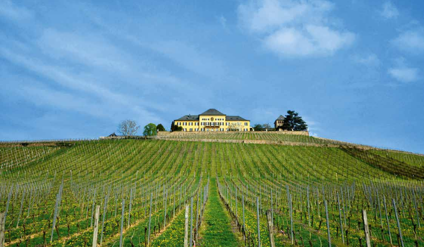
Schloss Johannisberg im Rheingau – die älteste Riesling-Domäne auf der Welt

Damit wurden die Rebgebiete neu gestaltet und dafür gesorgt, dass wir heute auf eine mittlerweile nahezu ununterbrochene 1200-jährige Weinkultur zurückblicken können. Eines der ältesten Weingüter in Deutschland ist das auf ein Kloster zurückgehende Schloss Johannisberg bei Geisenheim. Dort soll seit dem Jahr 772 n. Chr. Weinbau betrieben worden sein. In Österreich datiert die erste urkundliche Erwähnung des Weinbaus aus dem Jahr 731 n. Chr. in Spitz bei Krems. Und in der Schweiz gilt Rebanbau im heutigen Kanton Waadt mit der Hauptstadt Lausanne seit dem sechsten Jahrhundert als gesichert. Als älteste Weinberge Deutschlands gelten die Bereiche des „Niersteiner Glöck“, bei der Stadt Nierstein im Landkreis Mainz-Bingen. Die dortigen Weinberge sind in einer Schenkungsurkunde aus dem Jahr 742 n. Chr. erwähnt.