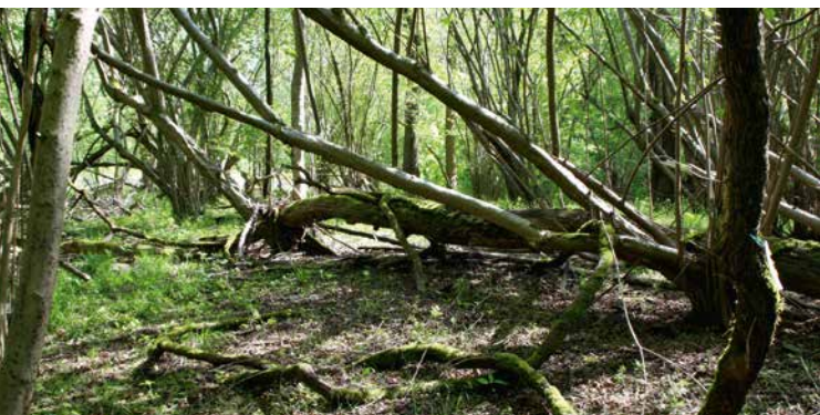
Streng geschützt: Urreben im Auwald der Rheininsel Ketsch.