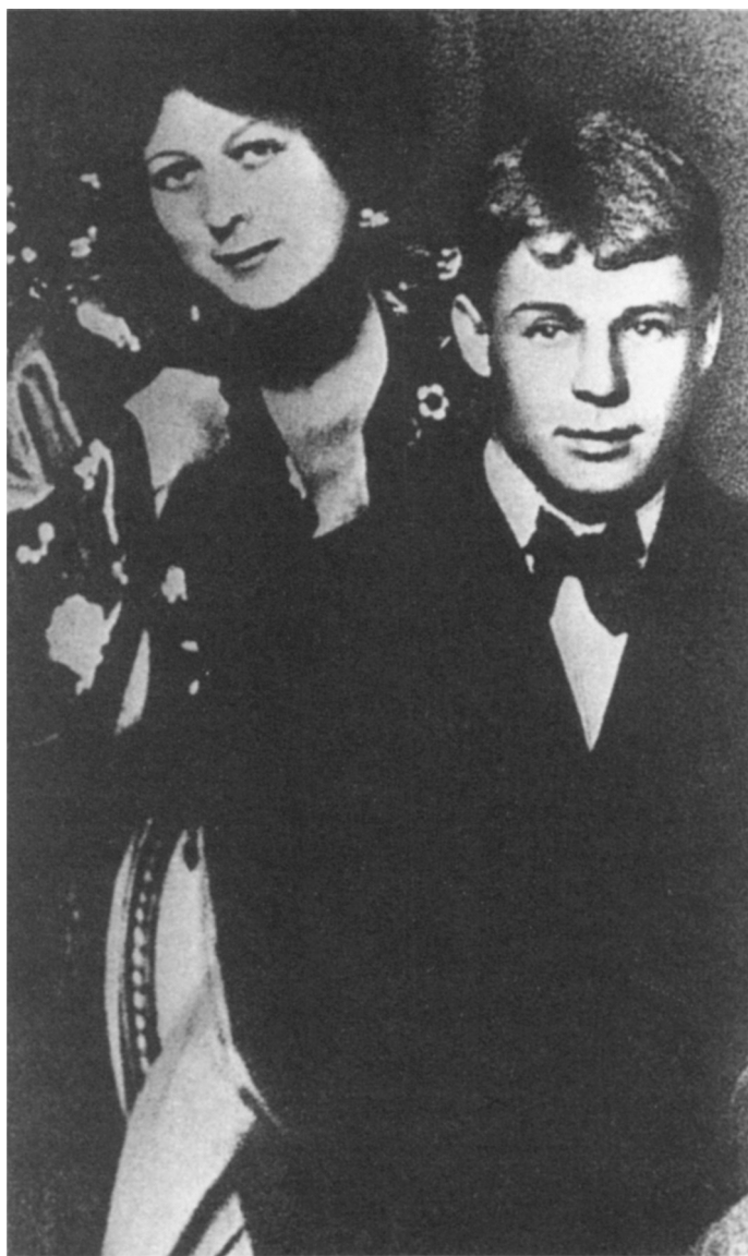
Isadora Duncan und Sergej Jessenin, 1923