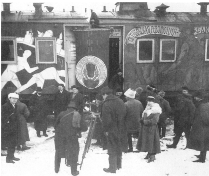
John Reed vor dem Propagandazug «Oktoberevolution», der von den Bolschewiki mit Schauspielern und Rednern durch die Sowjetunion geschickt wurde, um die Bevölkerung mit Flugblättern, Transparenten und Theaterstücken zu agitieren.