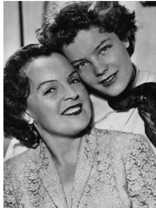
Die Mutter mit der Tochter: Magda und Romy Schneider