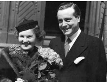
Magda Schneider und Wolf Albach-Retty am Tag ihrer Hochzeit

Am 23. September 1938 wird Rosemarie Magdalena Albach abends um etwa 22 Uhr in einer Wiener Klinik geboren, an