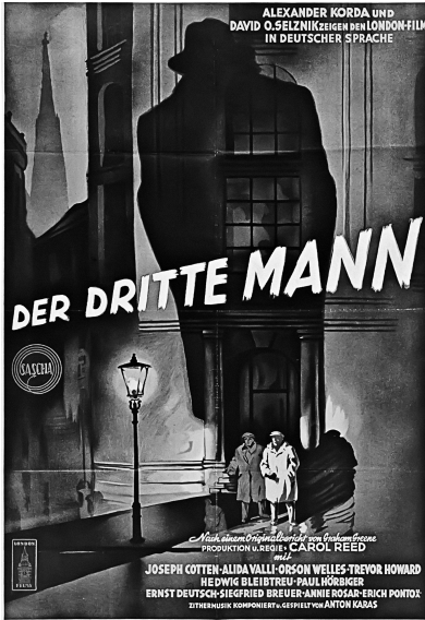
Eine graue Vorzeit der Literaturgeschichte: das Filmplakat zu Der dritte Mann

Juden. Man nannte sie »displaced persons«. Der aus Czernowitz, vom äußersten östlichen Ende des ehemaligen Habsburgerreichs, gekommene Paul Celan zählte zu ihnen. Und in Wien traf er Ingeborg Bachmann, die eine ganz andere Art von Heimatlosigkeit hergetrieben hatte. Im Mai 1948 war sie knapp zweiundzwanzig und Paul Celan siebenundzwanzig Jahre alt, und sie hatten wenig mit den beiden mythischen Figuren gleichen Namens zu tun, die in den siebziger und achtziger Jahren die deutschsprachigen Lesebücher und Universitätsseminare beherr-