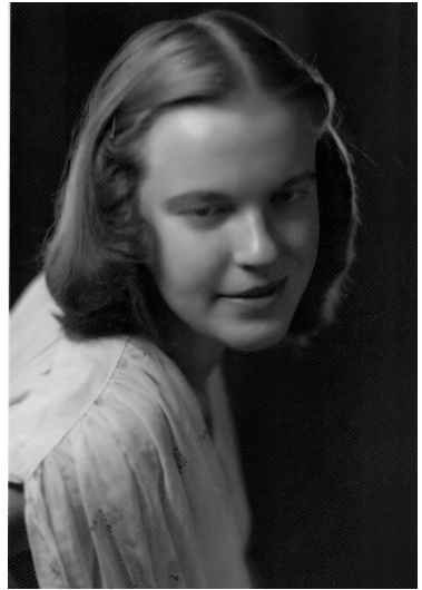
Ingeborg Bachmann 1945, im ersten Semester

Als sich Ingeborg Bachmann und Paul Celan am Abend des 16. Mai 1948 kennenlernten, war er also ein bereits viel bestaunter Lyriker und sie die Geliebte eines einflussreichen Literaturfunktionärs – der sich allerdings zu diesem Zeitpunkt gerade für ein Stipendium nach New York aufmachte. Dass sie Celan »etwas ins Auge fasste«, hatte sicher mit seiner ganz spezifischen poetischen Aura zu tun, einer Phantasmagorie des verschwundenen Habsburgerreichs, einem verloren gegangenen Charme. In den lyrischen Texten