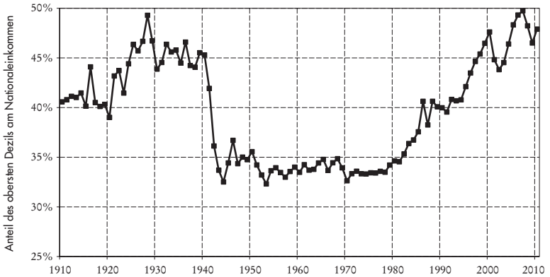
Grafik I.1.: Der Anteil des obersten Dezils am amerikanischen Nationaleinkommen ist von 45–50 % in den Jahren 1910–1920 auf weniger als 35 % in den 1950er Jahren gesunken (es handelt sich um den von Kuznets gemessenen Rückgang); dann ist er von weniger als 35 % in den 1970er Jahren auf 45–50 % in den Jahren 2000–2010 gestiegen.

Quellen und Reihen: siehe piketty.pse.ens.fr/capital21c .