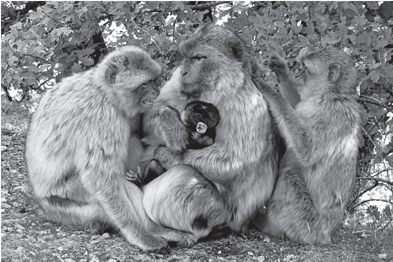
Abb. 3: Berberaffen in Rocamadour.

Die ersten Lebenswochen verbringt ein Affenkind in der Regel als »Tragling« 3 am Bauch der Mutter. Mit Händen und Füßen krallt es sich in ihrem Fell fest. Wenn es noch nicht die nötige Kraft hat, hält die Mutter manchmal unterstützend eine Hand un-