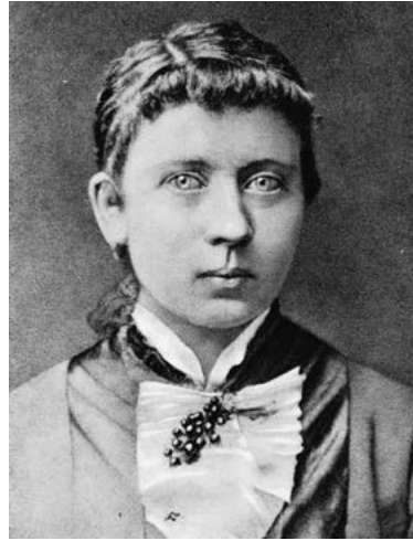
LINKS Alois Hitler, geb. Schicklgruber, in der Uniform eines Zollbeamten, Fotografie aus den 1880er Jahren. RECHTS Klara Hitler, undatierte Fotografie

Jahr wurde Alois Hitler in die oberösterreichische Stadt Linz an der Donau versetzt. Die Familie blieb zunächst noch in Passau wohnen und folgte ein Jahr später nach. 1896 kam ein weiteres Kind auf die Welt, Hitlers Schwester Paula. Die Familie Hitler zog mehrmals um. 1898 kam sie schließlich in das Dorf Leonding bei Linz.