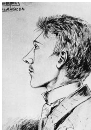
Hitler als sechzehn-jähriger Realschüler, Porträtzeichnung eines Mitschülers, 1905

In der Oper lernte er zufällig August Kubizek kennen, den etwas älteren Sohn eines Linzer Handwerkers, und freundete sich