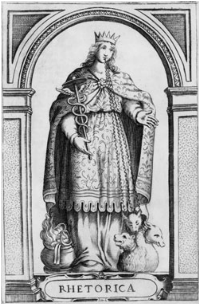
Rhetorica (Aus: Cristoforo Giarda, Bibliothecae Alexandrinae Icones Symbolicae , 1628)