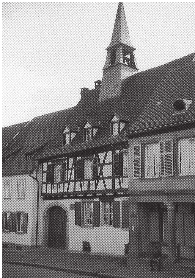
Das Geburtshaus in Kaysersberg