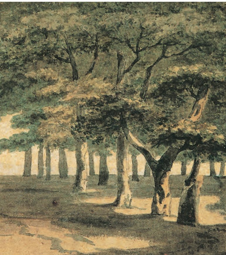
Allee in der Villa Borghese