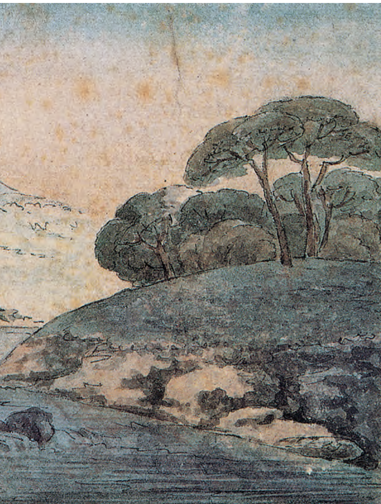
Flußlandschaft mit Brücke 1786