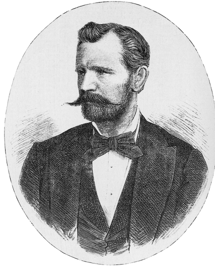
Abb. 1: Carl Humann. Stich in der «Berliner Illustrierten Zeitung» vom 4. November 1882

Carl Humanns stehen sollte – nicht nur die erste, sondern, wie sich rasch zeigte, eine ausgezeichnete Wahl.