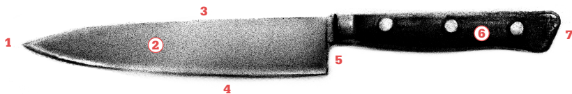
1 Messerspitze 2 Klingenspiegel 3 Rücken 4 Fase 5 Kropf 6 Heft 7 Knauf

nennt man „Messerrücken“. Ein guter Messerrücken sollte nicht zu scharfkantig geschliffen, sondern leicht abgerundet sein, damit sich die unterstützende Hand an ihm keine Schwielen oder Verletzungen holen kann. Der polierte Bereich zwischen Messerrücken und Fase heißt „Klingenspiegel“. Viele Messer haben einen Handschutz, der sicherstellt, dass keine Hand unter die Klinge gerät. Selbst der Teil des Messers, der sich zwischen Handschutz und Fase befindet, trägt einen eigenen Namen: Auf der „Fehlschärfe“, die auch „Ricasso“ genannt wird, finden Sie – gerade bei kleineren Messern – oft auch die Signatur der Marke, die so genannte „Schmiedemarke“.