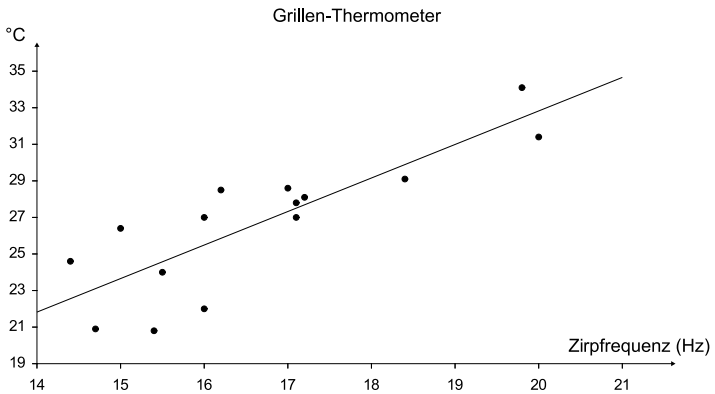
Abbildung 60: Regression von Temperatur versus Zirpfrequenz für eine Grillenart

Grillen sind offenbar genaue Temperaturfühler. Was liegt also näher, als sich eine possierliche Grille als Taschenthermometer zuzulegen?