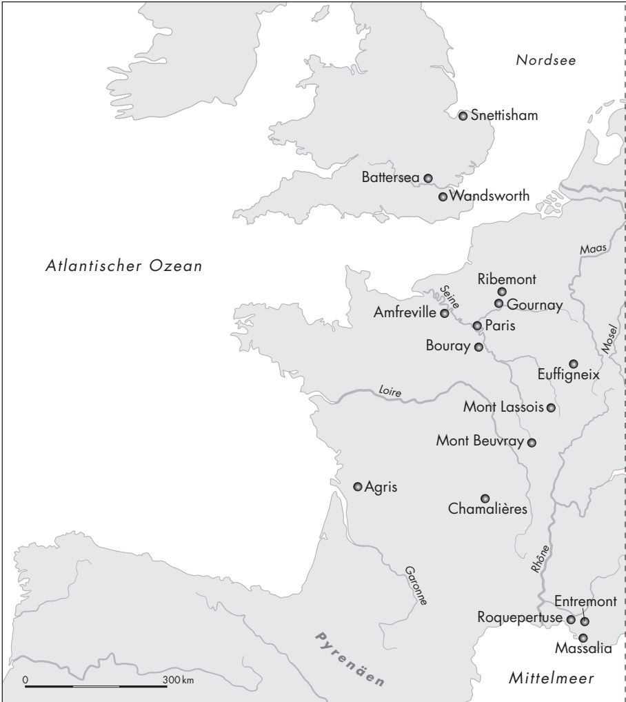
Keltische Fundstätten in Mitteleuropa

halb größerer Siedlungen noch weitgehend unberührt. Ein ausgebautes Straßen- und Wegenetz fehlte, zumal man sich für den Transport von Handelsgütern überwiegend der natürlichen Wasserstraßen bediente. Bäche und Flüsse waren nirgendwo reguliert, und ausgedehnte Wälder beherbergten eine Vielfalt von Tierarten. Die Mobilität des Großteils der Bevölkerung war zweifellos gering, so dass sich das Leben der