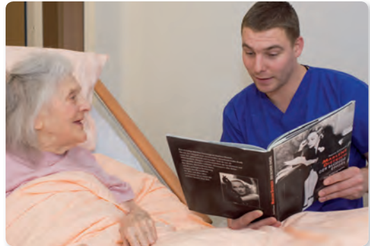
Abb. 1 Geistige Aktivierung

Auch wenn sich der Bettlägerige nicht mehr äußern oder aktiv teilnehmen kann, bieten Erzählen, Vorsingen oder Vorlesen noch Anregung. Gezielte Rundfunk- oder Fernsehsendungen an den Interessen orientiert, können auch eingesetzt werden. Kreative Ideen zur Anregung sind gefragt.