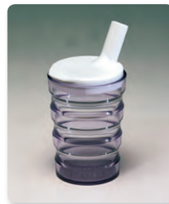
Abb. 1 Der Spezialbecher liegt sicher in der Hand

Sehr informativ ist der Auftritt von Thomashilfen unter www.thomashilfen.de . Dort sind alle einsetzbaren Hilfsmittel so abgebildet, dass deren Funktion nachvollzogen werden kann.