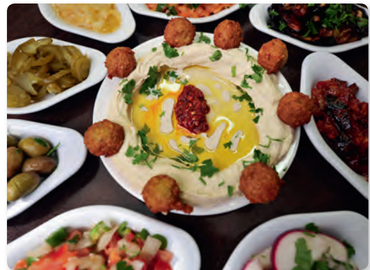
Abb. 1 Auch Essen ist ein Bestandteil von Kultur

Kultur ist nicht an die Grenzen eines Nationalstaats gebunden. Und auch innerhalb einer Nation existieren kulturelle Unterschiede je nach Alter, Geschlecht, sozialer Schicht oder Religion. Zur Kultur zählen z.B. Begrüßungsrituale, Kleidung, Essgewohnheiten, Kommunikation, Sprache, soziale Ordnung, Einstellung zu Familie und Freundschaft, Glauben oder die Rolle von Mann und Frau.