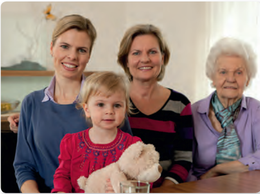
Abb. 1 Vier Generationen unter einem Dach

In ländlichen Gegenden gibt es z.T. noch das Zusammenleben mit den Kindern, wobei die Eltern oft auf ein sogenanntes „Altenteil“ ziehen. Voraussetzung dabei ist unter anderem die Kontinuität der Lebensgrundlage (z.B. führen die Kinder den Hof oder den Betrieb weiter), aber auch ausreichender Wohnraum für alle Beteiligten.