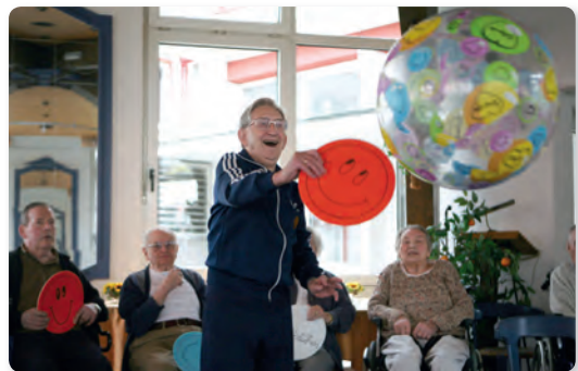
Abb. 2 Spontane Aktivität

So wichtig es ist, einen durchstrukturierten Tag mit geplanten Aktivitäten und Ruhezeiten zu haben, so unentbehrlich ist es, dass auch einmal etwas Unvorhergesehenes „passiert“. Kurze Aktivierungen können spontan durchgeführt werden, um Langleweile und Reizverarmung entgegenzuwirken, etwas Positives zu erleben und zu lachen. Hierzu ist es meist notwendig, auf die Bewohner zuzugehen oder sie anzuregen, indem man eine Beschäftigung beginnt. Auch hier sind Fantasie und ein Fundus an Möglichkeiten gefragt.