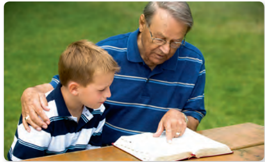
Abb. 1 Wissen weitergeben

Senioren geben ihr im Leben erworbenes Wissen und ihre Kenntnisse und Erfahrungen an Jüngere weiter. Aber auch sie erweitern ihren Horizont, indem sie Menschen in ihrem sozialen Umfeld kennenlernen. Sie begleiten lernschwache Kinder, helfen Migranten die deutsche Sprache zu erlernen, berichten als Zeitzeugen in Schulen. Sie trainieren in Senioreneinrichtungen den Gebrauch von Computer und Internet oder begleiten Berufsanfänger im neuen Lebensabschnitt.