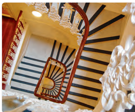
Abb. 1 Treppenhaus – behindertengerecht

Nicht alle festgestellten Probleme können von den Wohnungsbesitzern allein gelöst werden. Häufig betreffen „Mängel“ an der Ausstattung aber auch mehrere Mieter und das Raster wäre eine Möglichkeit, gemeinsam mit einer sachlich fundierten Anfrage an den Vermieter heranzutreten.