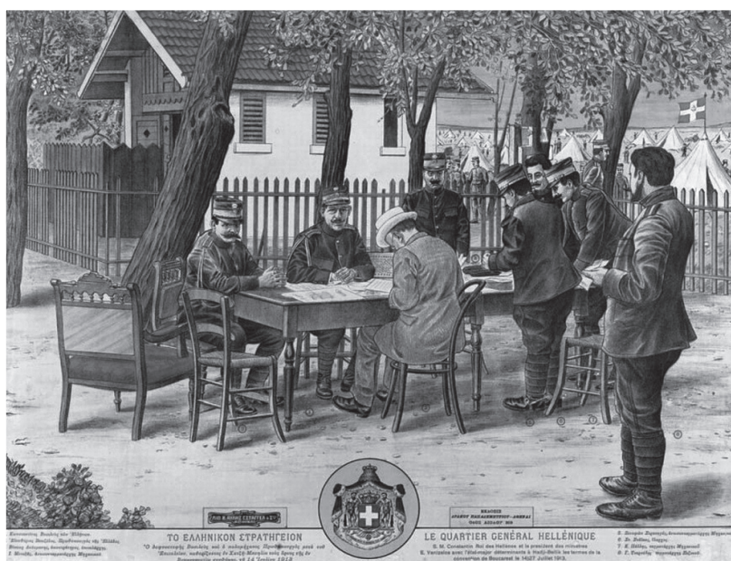
Das Griechische Hauptquartier Die Lithographie von Dimitrios Papadimitriou zeigt das Griechische Generalhauptquartier 1913 im Dorf Hadji-Beylik, wo Griechenlands Forderungen nach dem Ende des 2. Balkankriegs zur Vorbereitung des Friedenskongresses von Bukarest (1913) besprochen werden.