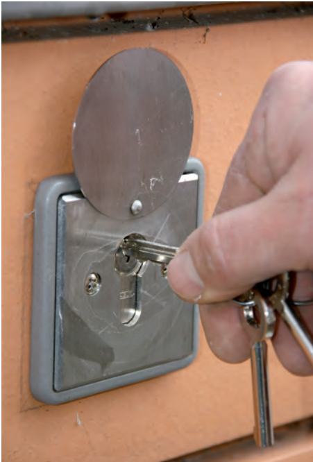
Bild 5: FSE in der Ausführung mit Profilhalbzylinder. Die Auslösung erfolgt durch einen Schlüsselschalter.

Im normalen Einsatzfall, also bei einer Auslösung der BMA, hat das FSE keine einsatzrelevante Bedeutung und muss daher vom Gruppenführer nicht beachtet werden.