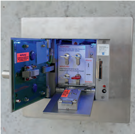
Bild 7: Beispiel für ein FSD 3 mit einer Aufnahme für vier Objekt- schlüssel

ter befindliche Innentür muss in der Regel mit der Doppelbart-Feuerwehrschißung (so genanntes Umstellschloß; allerdings sind auch andere Schließsysteme, beispielsweise mittels Profilhalbzylinder, grundsätzlich möglich) geöffnet werden. Dahinter ist der Objektschlüssel (meist ein Generalhauptschlüssel) in einer überwachten Schlüsselaufnahme deponiert.