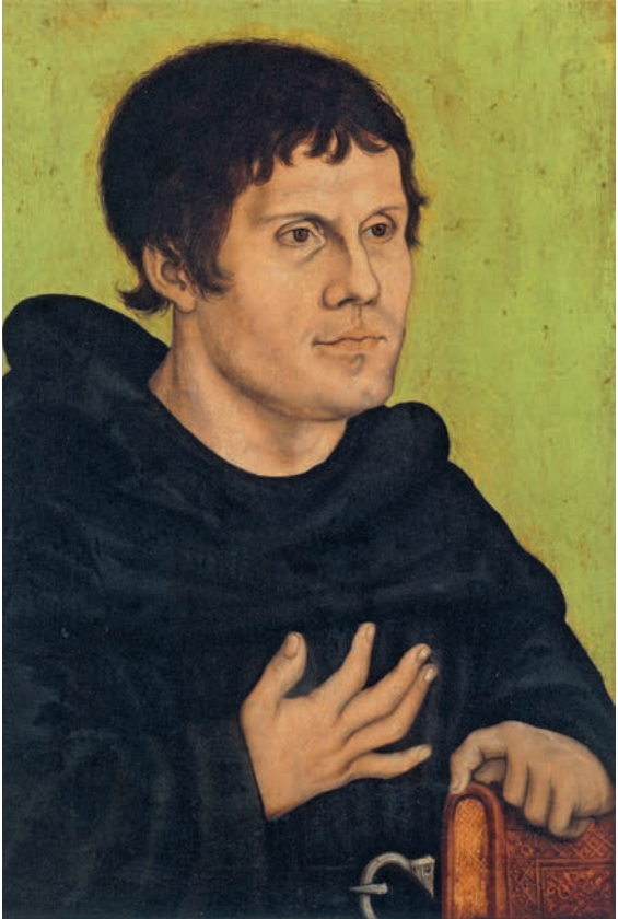
Luther als Augustinermönch, Cranach-Werkstatt