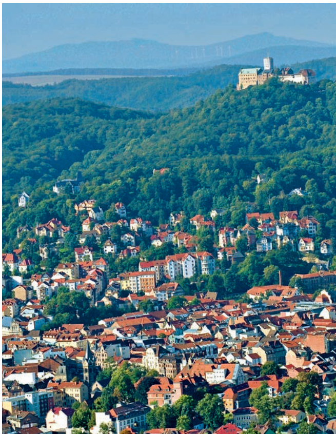
Eisenach mit der Wartburg