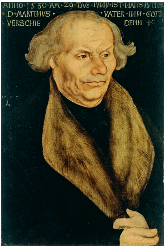
Lucas Cranach d. Ä., Hans Luther (um 1527)