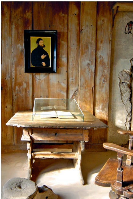
Das Luther-Zimmer auf der Wartburg