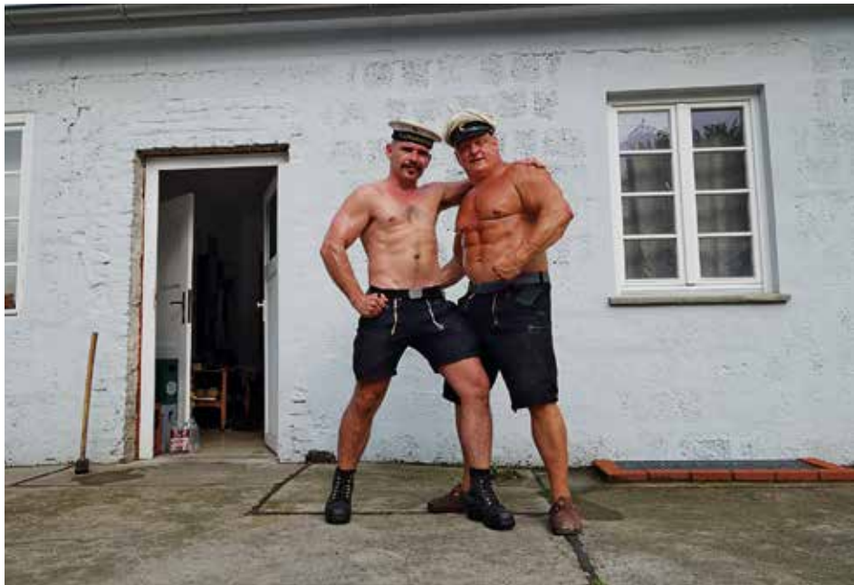
Der Käptn und sein Maat vor dem Heimathafen der MS Rummelsnuff

Schließlich produziert Blitz wunschgemäß noch eine zusätzliche Version mit dem portugiesischen Text. Hier blendet er weit-