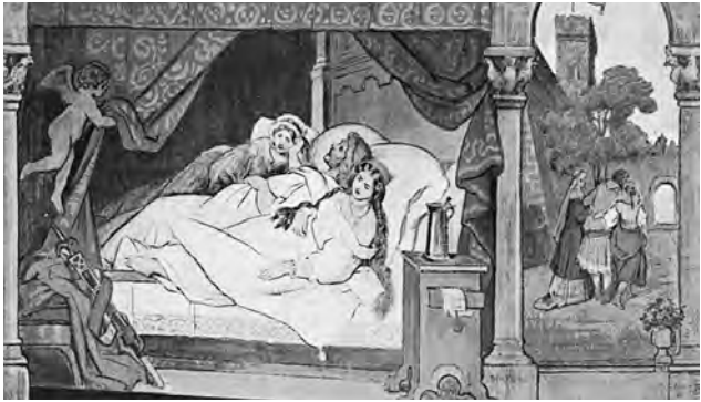
»Der zwiebeweibte Graf von Gleichen«. Wandgemälde auf der Feste Wachenburg

ihrer Hilfe) auf die Flucht. Als er unterwegs in Venedig erfuhr, daß ihn sein Traum getrogen hatte und seine Frau noch am Leben sei, reiste er mit seiner Gefährtin nach Rom zum Papst weiter, um sich von ihm ausnahmsweise die Matrimonialanomalie einer Ehe zu dritt genehmigen zu lassen. Und siehe, es gelang. Der Papst, der ganz entzückt war, eine Heidin taufen zu können, war auch nur ein Mann und wurde von ihrer Schönheit zum Einverständnis hingerissen. Darauf reiste der Graf mit Melechsala, die nun Angelika hieß, in die Heimat zurück, und die beiden wurden von seiner Gattin freundlich empfangen. Sie hatte schon seit längerem von der Rückkehr ihres Mannes und den damit für sie verbundenen Komplikationen erfahren und, anfangs sehr wenig begeistert, beschlossen, sich als gute christliche Ehefrau in den Willen ihres Mannes zu fügen und seine Retterin schwesterlich aufzunehmen. Sogar ein dreischläfriges Bett hatte sie als Liebestempel herstellen lassen, aus starkem Föhrenholz, mit der Farbe der Hoffnung überzogen, und einer rundgewölbten Decke, in Form eines Kirchhimmels, mit geflügel-