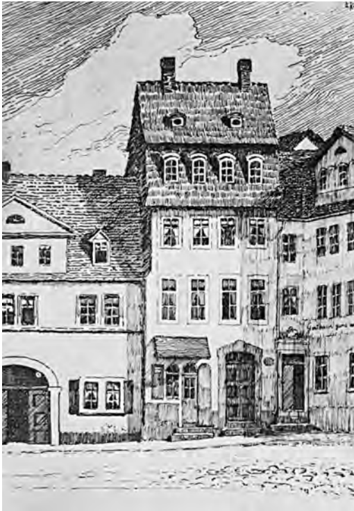
Schillers Wohnung am Frauenplan. Federzeichnung von O. Rasch