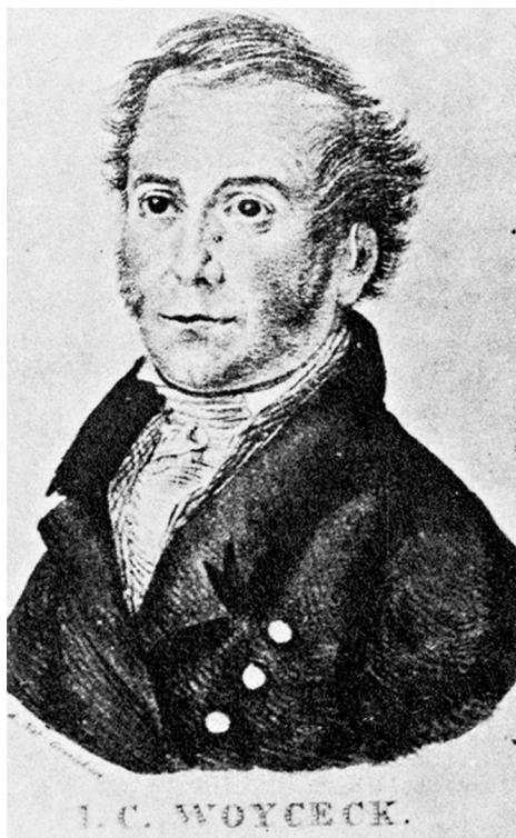
Abb. 2: Johann Christian Woyzeck. Anonymer Stich, 1824

arbeits- und obdachlos lebte. Er ging ein Verhältnis mit Johanna Christina Woost ein, der Stieftochter seines letzten Lehrherrn. Johanna Christina Woost hatte neben dem Verhältnis zu Woyzeck weitere Be-