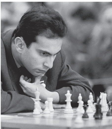
Abbildung 8: Michail Tal bei der Schacholympiade in Leipzig, 1960

Trainingswettkämpfe gegen Spasski, Michail Tal, Tigran Petrosian, Paul Keres und Wassili Smyslow erstellten ausführliche Dossiers über Stärken und Schwächen des Herausforderers. Einige dieser Schriftstücke sind vor kurzem aus russischen Archiven aufgetaucht. Hier sind Zitate aus einer Auswahl dieser Dossiers.