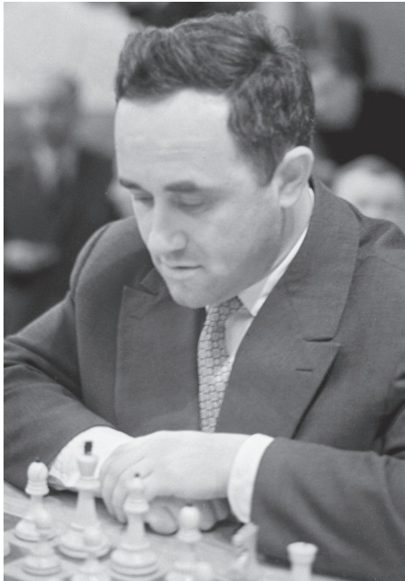
Abbildung 7: Efim Geller: Sekundant Spasskis, Ex-WM-Kandidat und herausragender Eröffnungstheoretiker. Er hatte ein positives Score gegen Fischer und galt als Angstgegner Fischers.

der die greifbaren Arrangements für das Match bislang nicht gesehen hatte, warf einen schnellen Blick auf die Bühne. (...)