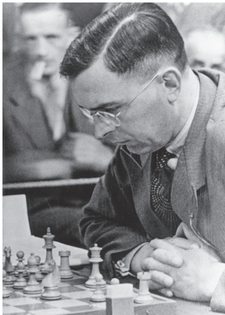
Abbildung 6: FIDE-Präsident Prof. Dr. Max Euwe, Schachweltmeister von 1935 bis 1937

zu bitten. Der Premierminister reagierte unmittelbar. Er kontaktierte den sowjetischen Botschafter Sergei Astavin und bat ihn eindringlich, seinen persönlichen Einfluss im Kreml zu nutzen, um sicherzustellen, dass die russische Delegation bleiben würde. Überraschend entschuldigte sich zudem Fischer am 6. Juli schriftlich und mündlich bei Spasski. Erst nach dieser unerwarteten Geste des Herausforderers schien das Match erneut auf Kurs zu sein.