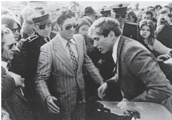
Abbildung 5: Bobby Fischer auf dem Weg zur dritten Partie

kriegen. (...) Er war fest entschlossen, den Wettkampf platzen zu lassen, aber als Kissinger mit ihm sprach und ihm sagte, dass er gegen die Russen kämpfen solle, spürten sie, dass sein Gesichtsausdruck sich änderte. (...) Er war wie ein junger Mann, der als Soldat in den Kampf zog, und er erklärte: «Ich werde gegen die Russen kämpfen.»»