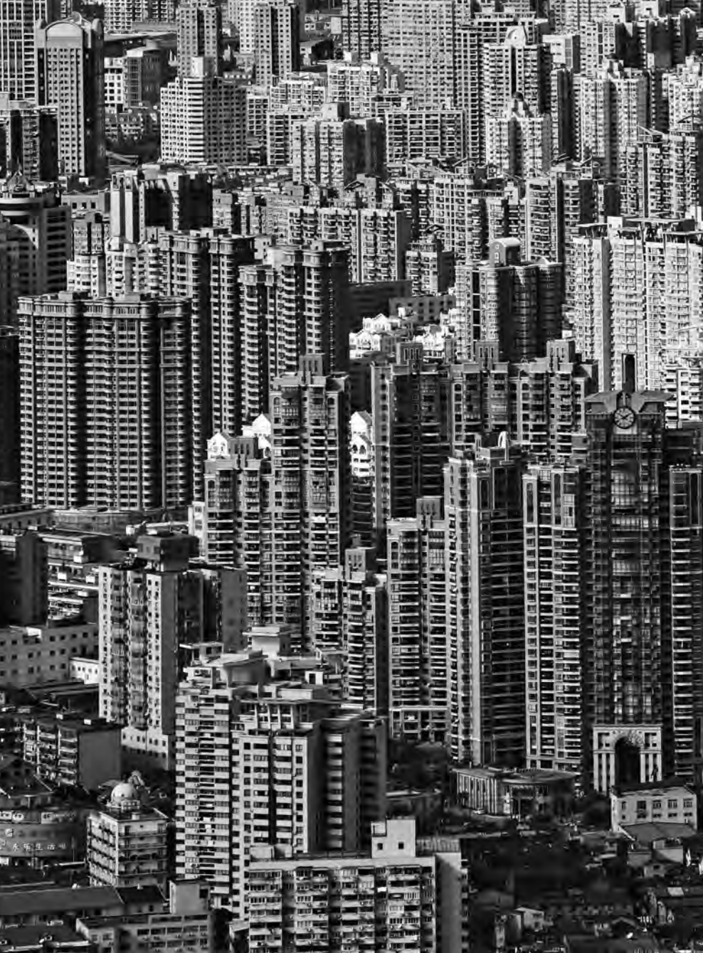
Wohnblocks in Schanghai