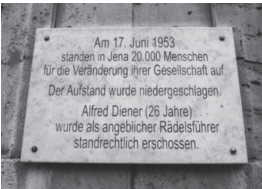
Gedenktafel für Alfred Diener am Holzmarkt in Jena