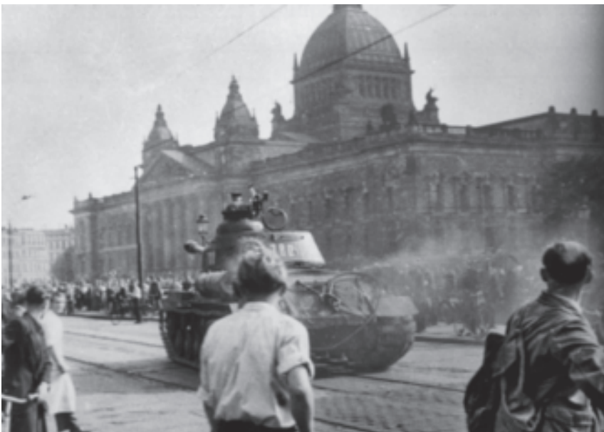
Sowjetischer Panzer rollt 1953 durch Leipzig am Reichsgericht vorbei

Die Sowjetische Besatzungsmacht verhängte den Ausnahmezustand, verkündete das Kriegsrecht und schlug mit militärischen Mitteln den Aufstand nieder. Mehr als 50 Todesopfer waren zu beklagen. Bereits einen Tag nach den Aufständen wurden diese von den SED-Machthabern als „faschistisch gesteuert und provoziert“ dargestellt.