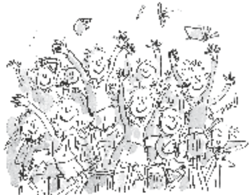
Die Kinder von der Dahlheim-Schule