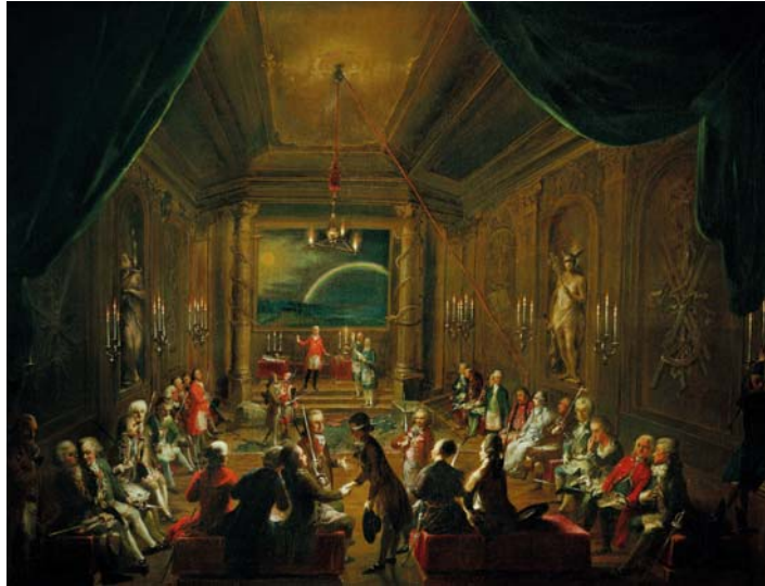
Sitzung der Freimaurerloge «Zur Gekrönten Hoffnung» um 1790 mit Wolfgang Amadeus Mozart (vorne rechts). Bis zu seinem Tod ist er ein engagiertes Mitglied. Seine letzte vollendete Komposition KV 623 galt der Einweihungsfeier eines neuen Tempels.