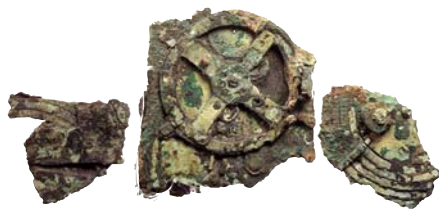
Der Antikythera-Computer, geborgen aus einem 2000 Jahre alten Schiffswrack

Differenzialgetriebe, das einen Sonnen- und einen Mondkalender synchronisierte – eine Getriebeart, wie sie in Westeuropa erst im 14. Jahrhundert «erfunden» wurde.