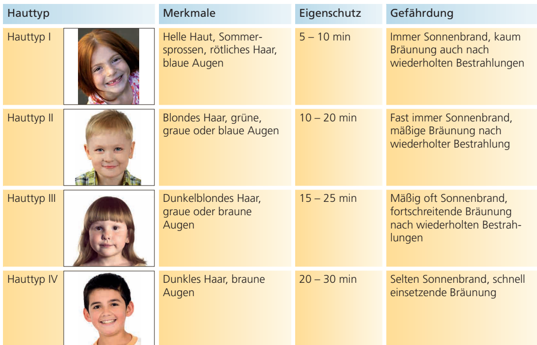
Tabelle 10.3 Hauttypen und deren Gefährdung durch die Sonne (nach: Umwelt und Gesundheit in Deutschland, BfS, 2005)

violette Strahlen (UV-Strahlen) , die neben Sonnenbrand auch die Haut vorzeitig altern lassen, zu Hautkrebs führen oder das Immunsystem schwächen können. Eine hohe UV-Dosis in den ersten Lebensjahren erhöht die Gefahr für die Entstehung von Hauttumoren. Die Haut „vergisst“ den Schaden früherer Sonnenbrände nicht. Drei Viertel der gesamten UV-Strahlung, der ein Mensch in seinem Leben ausgesetzt ist, erhält er etwa bis zu seinem 20. Lebensjahr.