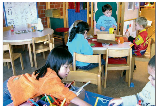
Die freie Wahl des Spielpartners und des Spielbereichs fördert die Individualität des Kindes

Dem kann Rechnung getragen werden, indem die Kinder häufig die Freiheit zur Mitgestaltung des Tagesablaufs haben. Dies kann z. B. in Kinderkonferenzen geschehen oder bei der freien Auswahl einzelner Themen, Spiele oder Spielbereiche.