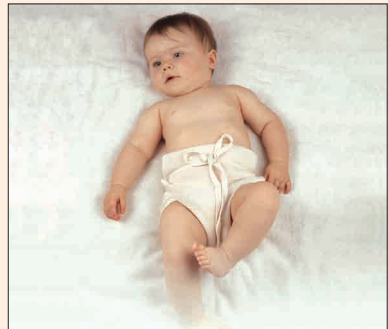
Baby in Stoffwindel