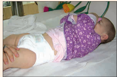
Baby in Einmalwindel