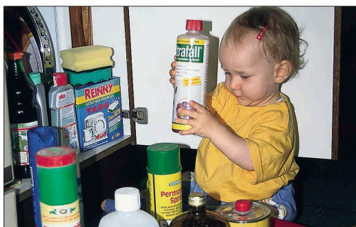
Gefahrstoffe sicher aufbewahren!

Die Tabellen (→ S. 97 f.) zeigen, welche Gefahren sich im täglichen Leben für Kinder verschiedener Altersstufen ergeben können und wie ihnen vorgebeugt werden kann