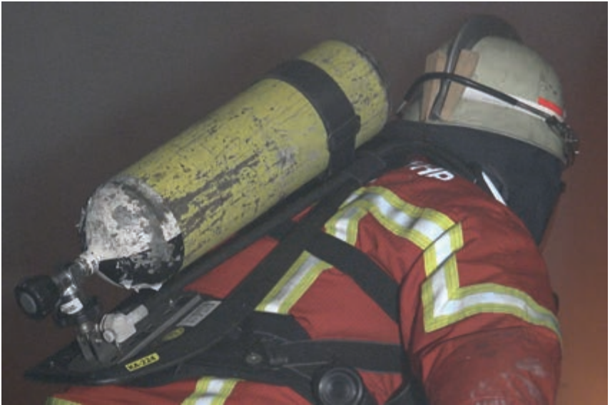
Bild 4: Der Holzkeil am Helm kann zielführend sein, sofern er mit Verstand eingesetzt wird.