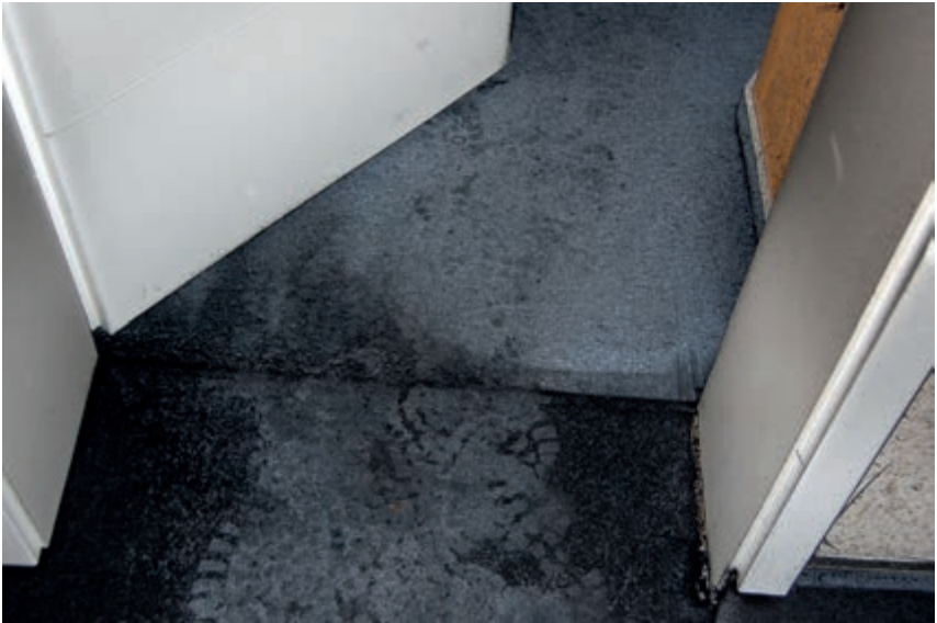
Bild 3: Abdrücke von kontaminierten Einsatzstiefeln jenseits der Schwarz/Weiß-Grenze lassen sich nicht immer vermeiden, sollten in manchen Fällen aber zum Nachdenken anregen.

Es wird uns nie gelingen, fehlerfrei zu arbeiten, perfekt zu werden. Wir müssen jedoch unsere Fehler erkennen und sie bewusst machen. Wir müssen nach den Ursachen der Fehler suchen und konsequent an der künftigen Vermeidung dieser Fehler arbeiten (Qualitätsmanagement). Die häufig gebrauchten Argumente wie »das haben wir immer schon so gemacht« beziehungsweise »das haben wir noch nie so gemacht« helfen uns dabei nicht weiter.