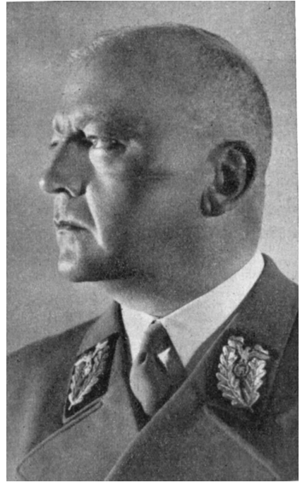
Abb. 4: Gauleiter und bayerischer Staatsminister des Innern Adolf Wagner, Foto 1940.

Weitere Hinweise findet man im Staatsarchiv München in den Spruchkammerakten über Oberhuber und einige seiner Mitarbeiter. Verschiedene Bestände des Bayerischen Hauptstaatsarchivs München sowie des Stadtarchivs München