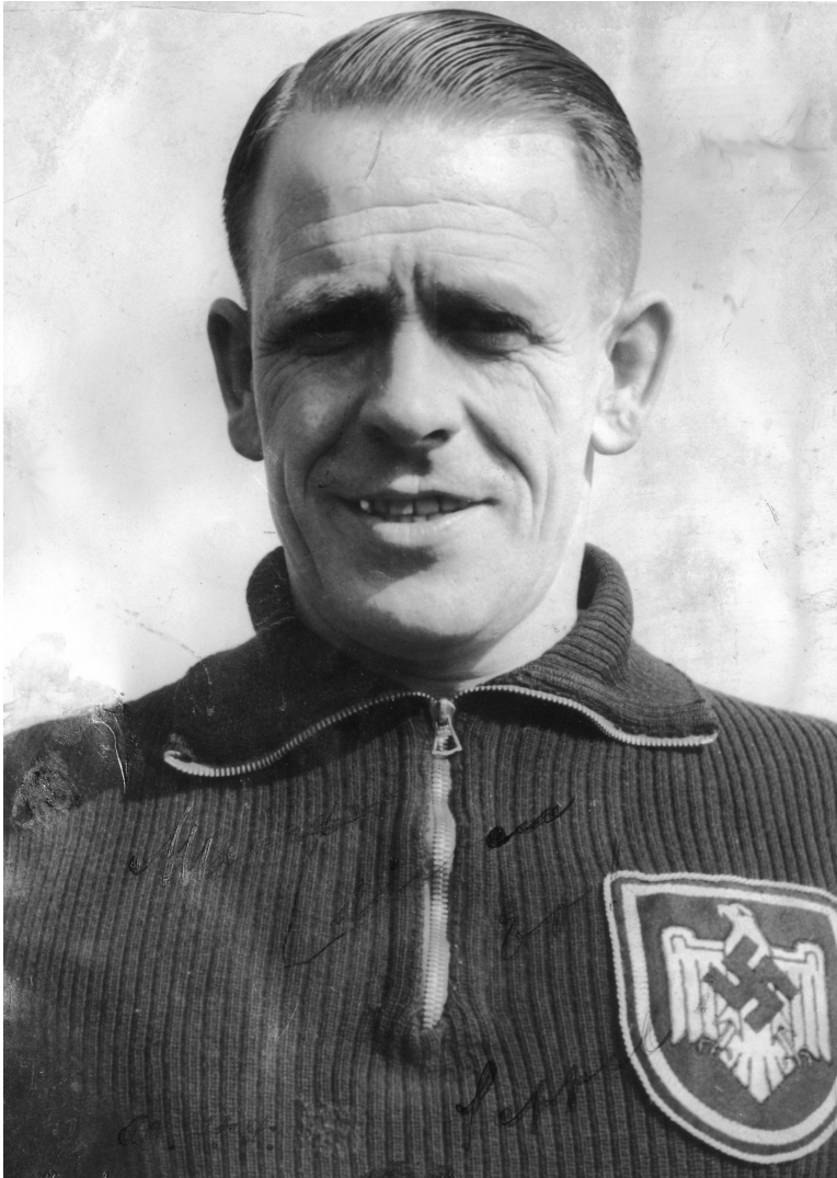
Abb. 1: Reichstrainer Josef Herberger mit Abzeichen des NSRL, Foto 1943.

Herberger von höchstem Interesse. Bietet er doch exemplarische Anknüpfungspunkte für die Interpretation der Rolle von Funktionsträgern, die nicht nur in den zwölf Jahren der NS-Zeit an der Organisation des Sports in verantwortlichen Positionen beteiligt waren.