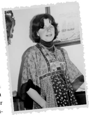
Pummelig im Patchworkkleid: Mein 18. Geburtstag