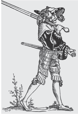
Ein deutscher Landsknecht (um 1550).

zuwachs der Territorialfürsten zurückzuführen war. 11 Nachdem diese ihre Kontrolle über entstehende Flächenstaaten wie das Herzogtum Württemberg oder das Kurfürstentum Brandenburg gefestigt hatten, schickten sie sich allerdings an, noch mehr Land zu erobern, und verwendeten einen großen Teil ihres Vermögens darauf, große Söldnerheere aufzustellen. Dieser Kriegsdurst fiel in eine Zeit des wirtschaftlichen Niedergangs mit einer außerordentlich langen Phase der Inflation und hoher Arbeitslosigkeit, die einfachen Leuten vom Kriegsdienst abgesehen oft keine Aussicht auf Beschäftigung bot. Die Historiker sprechen deshalb auch vom langen 16. Jahrhundert (um 1480 – 1620). In der Frühen Neuzeit wuchs die Zahl der Söldner um das Zwölfwache. Land und Leute waren nun allerorten einer furchterregenden neuen Gefahr für die persönliche Sicherheit und den Besitz ausgesetzt: den ebenso berüchtigten wie verachteten Landsknechten.