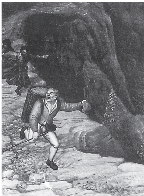
Ein einsamer Hausierer gerät in einen Hinterhalt von Straßenräubern; Detail aus einem Landschaftsgemälde von Lucas I. van Valckenborch (um 1585).

Von all den Verbrechen, die mit Räuberbanden und anderem umherstreifendem Gesindel in Verbindung gebracht wurden, fürchtete die Landbevölkerung eines am meisten: Brandstiftung. In einer Zeit lange vor der Gründung von Feuerwehren und Gebäudeversicherungen brachte allein das Wort die Gemüter in Wallung. Schon eine Fackel konnte, geschickt platziert, einen Bauernhof oder gar ein ganzes Dorf in Schutt und Asche legen und die wohlhabenden Bewohner binnen weniger als einer Stunde zu obdachlosen Bettlern machen. Tatsächlich wurde schon die Androhung, jemandem das Haus oder die Scheune anzuzünden, als gleichbedeutend mit der Tat selbst angesehen. Deshalb stand auch die gleiche Strafe darauf: Tod durch Verbrennen