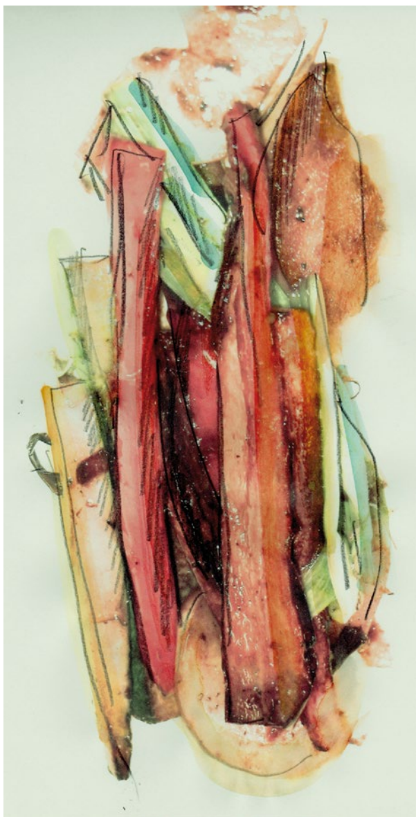
La torre di legumi