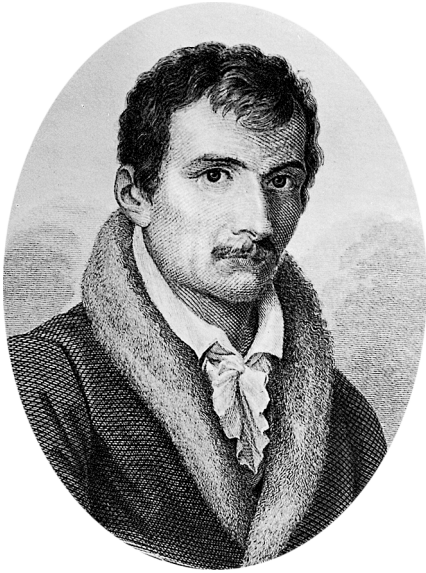
1 Johann Gottfried Seume Stahlstich nach einer Miniatur von V. H. Schnorr von Carolsfeld