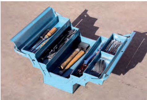
Bild 2 Standards sind wie Werkzeuge in dieser Kiste. Sie sind gut und brauchbar und kommen dennoch nicht an jeder Baustelle (Einsatzstelle) zum Einsatz. Die Fähigkeit des Handwerkers (Führungskraft), im richtigen Moment das richtige Werkzeug (Standard) zum Einsatz zu bringen, macht den Unterschied. Eine gute Führungskraft löst auf der Grundlage immer gleicher Standards – durch Planung und zielorientierte Kombinationen – völlig unterschiedliche Aufgaben.

Die Führungskräfte sind gefordert, durch die Auswahl der anzuwendenden Standards in einer zu definierenden Reihenfolge innerhalb des ihnen zugewiesenen Zuständigkeitsbereichs den angestrebten Einsatzerfolg herbeizuführen. Vor Ort ist zu entscheiden, ob beispielsweise der Standard »Menschenrettung über Steckleiter« oder »Menschenrettung über den Treppenraum« zur Anwendung kommen soll.