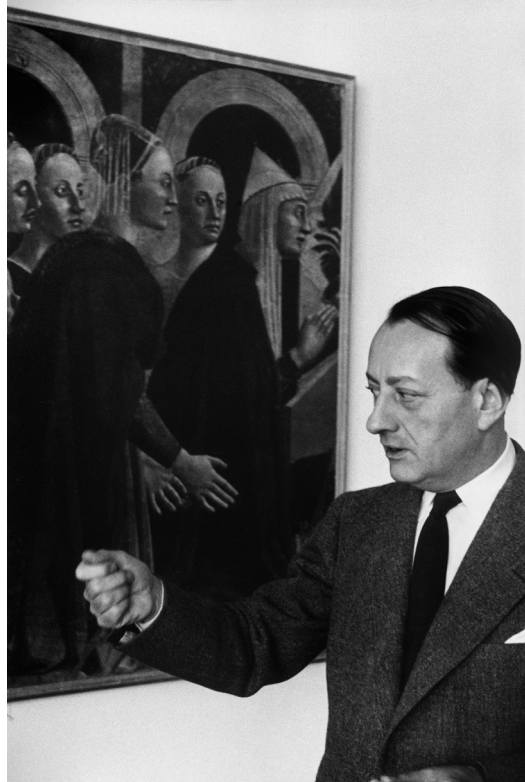
André Malraux, 1956

Im redaktionellen Teil einer Illustrierten war das Buchprojekt jedenfalls so optimal platziert, wie Verlage sich das ansonsten nur erhoffen können. Und so sehen wir Malraux hier in zwei seiner vielen Lebensrollen, bei der Buchherstellung wie bei der Öffentlichkeitsarbeit.